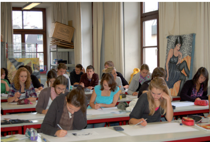
Aus dem Kunstunterricht

Im Musischen Gymnasium werden neben musikalischer Anlagen besonders Kreativität und soziale Kompetenzen gefördert. Voraussetzungen für die Wahl des Musischen Gymnasiums sind Freude an der Musik, am Singen und Musizieren. Ausgangspunkt der Ausbildung ist eine musikalische Durchschnittsbegabung, gefördert werden Anfänger ebenso wie Fortgeschrittene. Der Musische Zweig bietet zudem einen vertieften Unterricht in Kunsterziehung.