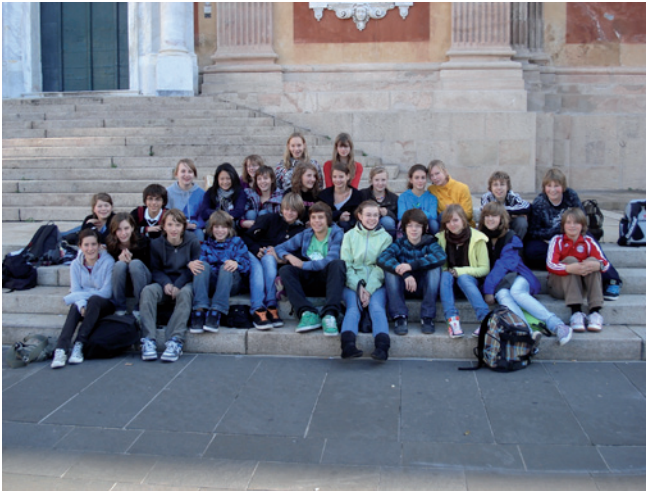
Austausch mit unserer Partnerschule in Segré

Das Albertus-Gymnasium unterhält seit Jahren enge Kontakte mit Schulen in Norwegen, Italien und Frankreich. Besonders intensiv ist dabei die Zusammenarbeit mit dem Collège Saint-Joseph in Segré, der französischen Partnerstadt Lauingens. Seit mehr als zwei Jahrzehnten finden in jedem Schuljahr zwei Austauschmaßnahmen