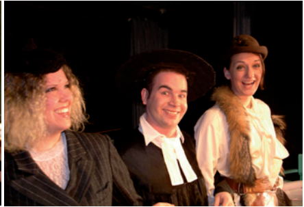
Theater am AGL