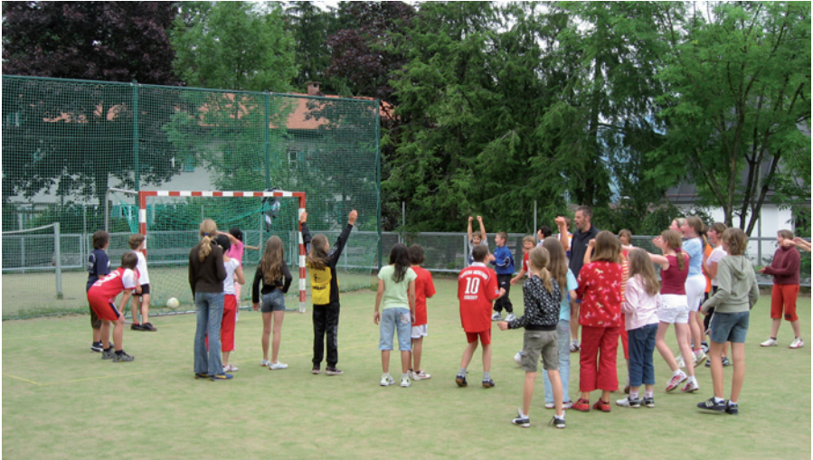
Aus dem Schullandheim

Bereichert wird unser Schulleben durch zahlreiche Veranstaltungen an der Schule, aber auch durch Fahrten und Exkursionen in allen Fachbereichen, die den Unterricht ergänzen und bereichern. Den Abschluss der 5. Jahrgangsstufe bildet dabei der Schullandheimaufenthalt im Allgäu. Die begleitenden Lehrkräfte verstehen es ausgezeichnet, ein vielseitiges Programm, bestehend aus sportlichen und kreativen Elementen, zusammenzustellen. Langeweile kommt in unserem schönen Schullandheim in Seyfriedsberg im Allgäu sicher nicht auf und auch das Heimweh ist in geselliger Runde kaum einmal ein Thema.