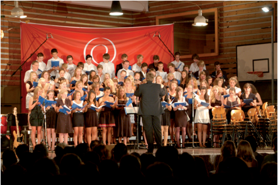
Großer Chor Al Cantus

Im Musischen Gymnasium werden neben musikalischer Anlagen besonders Kreativität und soziale Kompetenzen gefördert. Voraussetzungen für die Wahl des Musischen Gymnasiums sind Freude an der Musik, am Singen und Musizieren. Ausgangspunkt der Ausbildung ist eine musikalische Durchschnittsbegabung, gefördert werden Anfänger ebenso wie Fortgeschrittene. Der Musische Zweig bietet zudem einen vertieften Unterricht in Kunsterziehung.