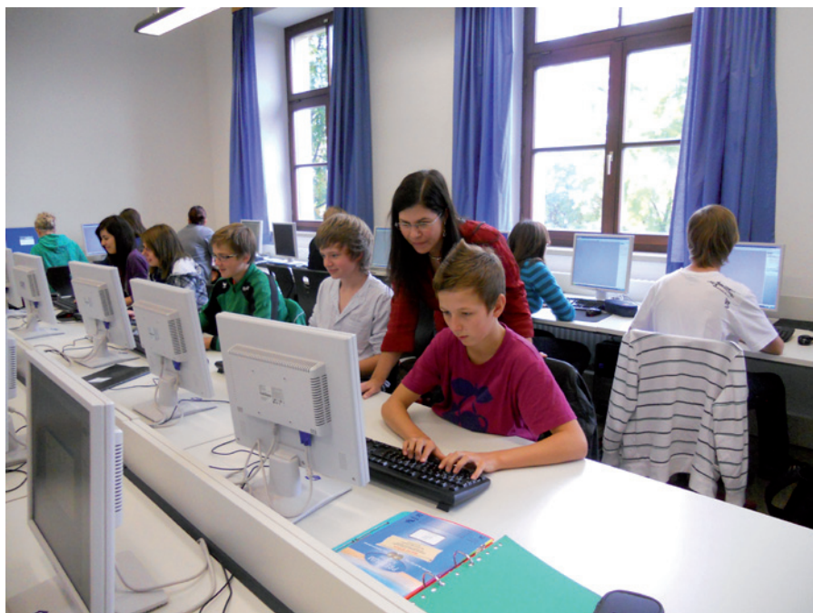
Wirtschaftsunterricht im Computerraum

Der Unterricht vermittelt den Schülern durch die Anwendung von Standardsoftware moderne Computerkenntnisse (Textverarbeitung, Tabellenkalkulation, Datenbanken, Präsentationssoftware) sowie Einblicke in die Gefahren der Nutzung des Internets. Zudem lernen die Schüler wesentliche Grundzüge des Rechnungswesens (Bilanz, Gewinn- und Verlustrechnung) sowie rechtliche Regelungen zum Datenschutz und zum Urheberrecht kennen.