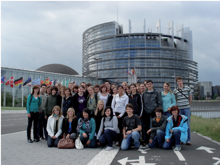
Unsere Schüler in Straßburg

Nomen est omen - im Sprachlichen Gymnasium (SG) werden sich vor allem Schüler zu Hause fühlen, die sich gerne mit Fremdsprachen beschäftigen (sowohl in gesprochener wie in geschriebener Form) und die neugierig sind auf andere Kulturen, Lebensstile und Mentalitäten. So sind die Voraussetzungen für die Wahl des sprachlichen Zweiges Offenheit, Neugier und die Bereitschaft, sich mit drei Fremdsprachen intensiv auseinander zu setzen. Die Bandbreite des sprachlichen Angebots und die über die Sprachen transportierten landeskundlichen Inhalte erweitern den Horizont des Lernenden, fördern seine soziale Kompetenz und machen ihn „fit“ für eine Zukunft im vielsprachigen Europäischen Haus.