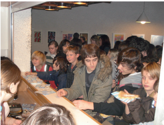
Deutsch-französischer Tag am AGL

Das Sprachliche Gymnasium stattet die Schüler mit dem sprachlichen Rüstzeug aus, das sie als zukünftige Arbeitnehmer in der Europäischen Union benötigen werden. Fremdsprachenkenntnisse sind Schlüsselkompetenzen, auf die international operierende Firmen zunehmend Wert legen. Wichtige Qualifikationen in den Bereichen Mathematik, Naturwissenschaften, Gesellschaftswissenschaft, Kunst, Musik und Wirtschaft, die auch im Sprachlichen Gymnasium vermittelt werden, werden durch das Erlernen von mehreren Fremdsprachen erweitert und auf eine internationale Ebene gehoben. So steht einem erfolgreichen beruflichen Werdegang innerhalb und außerhalb der Grenzen des eigenen Landes nichts mehr im Wege.