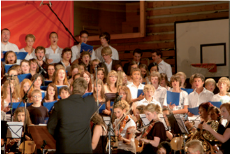
Schlussstück bei der Serenade

Austausch mit unserer französischen Partnerstadt Segré großer Beliebtheit. Wer gerne italienische Lebensart in einer pulsierenden Hafenstadt kennen lernen möchte, ist mit uns in Genua genau richtig. Die bundesdeutsche Hauptstadt Berlin mit ihrem reichen Kulturangebot steht auf dem Programm der 10. Jahrgangsstufe, bevor eine Studienreise in der 11. Jahrgangsstufe das Fahrtenprogramm abschließt. Für all diese Fahrten stehen grundsätzlich auch Fördermittel bereit.