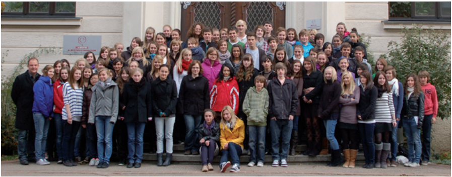
Der Arbeitskreis Solidarität hilft Menschen in Not

Umgang mit älteren oder behinderten Menschen sammeln die Schüler beispielsweise in Seminaren der Oberstufe. Besinnungstage und die Möglichkeit der Nutzung eines Meditationsraumes fördern Selbsterfahrung, Persönlichkeitsentwicklung sowie soziales Miteinander. Schulgottesdienste zu verschiedenen Anlässen und Morgenbet können auf freiwilliger Basis besucht bzw. durchgeführt werden.