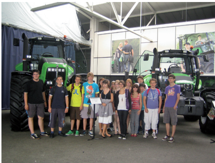
Betriebsbesichtigung bei der Fa. Deutz

Praxisbezug erhalten die im Unterricht besprochenen Inhalte beispielsweise durch Betriebserkundungen, Expertenvorträge, Planspiele und das einwöchige Berufspraktikum in der 9. Jahrgangsstufe.