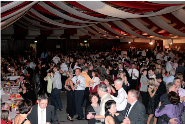
Wohltätigkeitsball des AKS

Gerade in der heutigen schnelllebigen Zeit ist es für eine Schule in besonderer Weise notwendig, sich den rasch wechselnden Erfordernissen zu stellen, die von der Gesellschaft an ein Bildungsinstitut herangetragen werden. Diese sind nicht nur bedingt durch eine unaufhaltsam zusammenwachsende Welt, durch die dadurch notwendige Toleranz für andere Menschen, anderes Denken und andere Kulturen, sondern auch durch die Tatsache, dass Schule immer mit jungen Menschen zu tun hat. Diese jungen Menschen sollen in die Lage versetzt werden, ihre eigene Zukunft zu bestehen, aber auch die Zukunft unserer Gesellschaft, Europas und der Welt zu gestalten. Dies soll unsere Aufgabe sein.