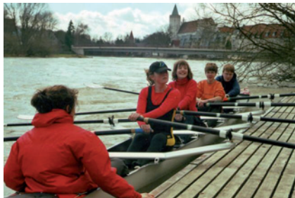
Schüler beim Rudersport

Als Stützpunktschule für Rudern bietet das AGL ein außergewöhnliches Angebot im Rahmen des Schulsports. Die Erfolge auf Landes- und Bundesebene zeugen vom sportlichen Können und dem Trainingsfleiß der Kinder.