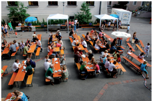
Schulfest am AGL

Unsere Schüler tragen maßgeblich zum Erfolg des Schulfestes am Schuljahresende oder zum Tag der offenen Tür bei. Insbesondere die Konzerte unserer Jüngsten im Herbst und im Sommer zeugen vom musikalischen Talent der Kinder.