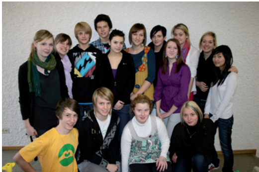
Unsere Tutoren im Schuljahr 09/10

Ihr Kind ist damit vielen neuen Anforderungen und Belastungen ausgesetzt, denen wir mit verschiedenen Maßnahmen begegnen. Der Kennenlern-Nachmittag zu Beginn des Schuljahres dient dazu, sich mit neuen Mitschülern in geselliger Runde anzufreunden. Unsere Tutoren der 10. Jahrgangsstufe stehen gleich zu Beginn des Schuljahres als „Begleiter“ bereit und bereichern zusätzlich mit verschiedenen Veranstaltungen während des gesamten Jahres das Schulleben Ihrer Kinder.