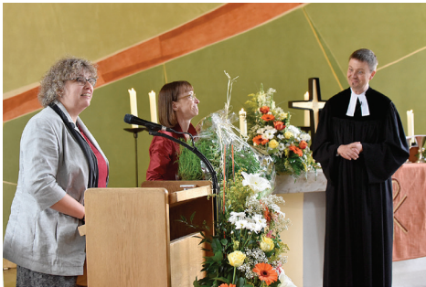
Verabschiedung bei der Konfirmation