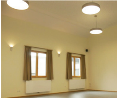
Die neue Beleuchtung im großen Gemeindesaal

Für die neue Beleuchtung in und außerhalb unseres Gemeindehauses ist das Kirchgeld dieses Jahr bestimmt. Der Bauausschuss hat moderne, elegante Lampen ausgewählt, welche gut zum Gesamtbild des neu renovierten