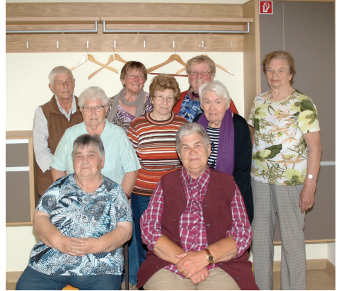
Die Bastelgruppe vor der neuen Garderobe

Ein herzliches Dankeschön an unsere fleißige Bastelgruppe, die der Gemeinde die neue Garderobe gespendet hat. Auch wenn im Sommer keine Jacken an ihren Bügeln hängen, so wird sie doch immer gebraucht. Denn der Feuerlöscher und der Erste-Hilfe-Koffer haben hier ihre Plätze gefunden. Und wenn mal etwas aufgekehrt werden muss, dann findet man im Schrank auch einen Besen und eine Kehrschaufel.